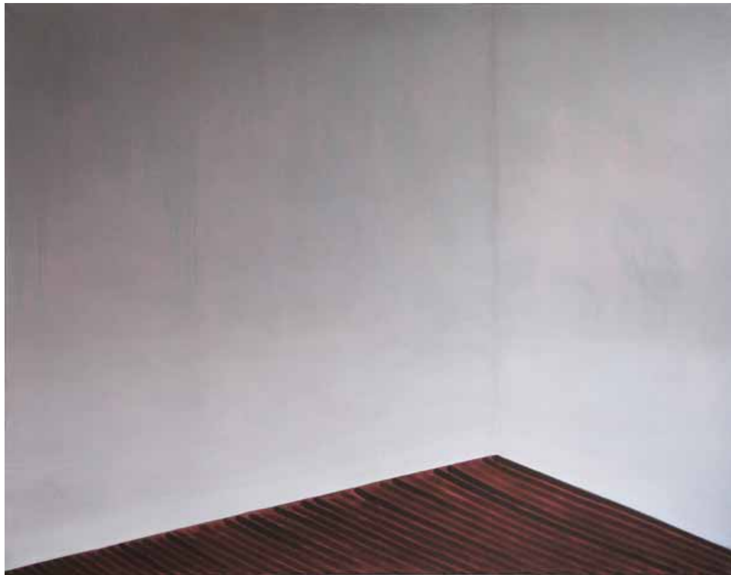
Ecke 2 140 x 180 cm