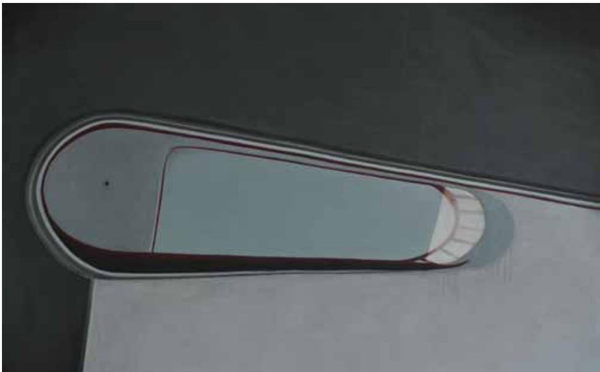
Treppe 140 x 200 cm