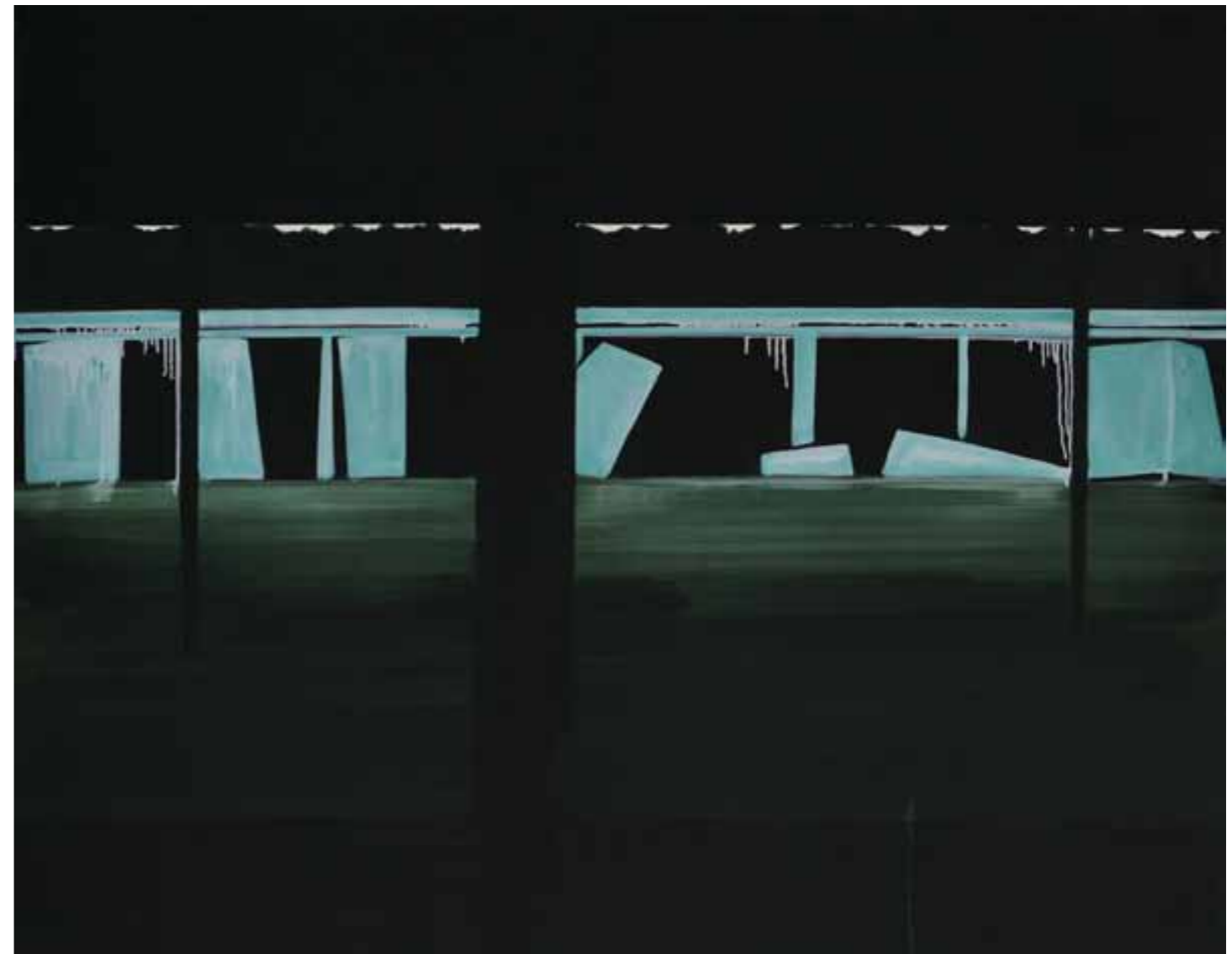
Hoehlen 120 x 160 cm